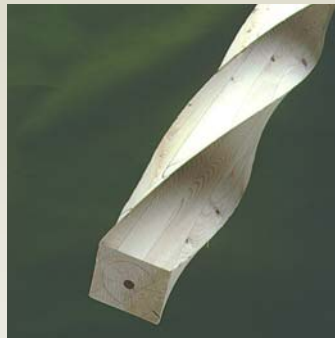
Søjle S6 - Gran Form: kvadratisk / 1 1/2 Dimensioner: 90 - 350 mm Længde: 0 - 6000 mm