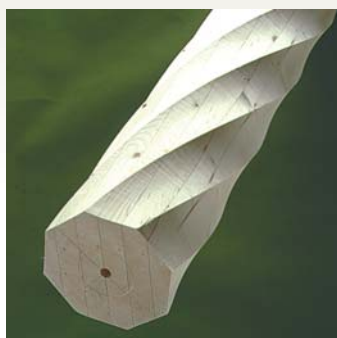
Søjle S9 - Gran Form: 8-kantet / 1 1/2 Dimensioner: 90 - 350 mm Længde: 0 - 6000 mm