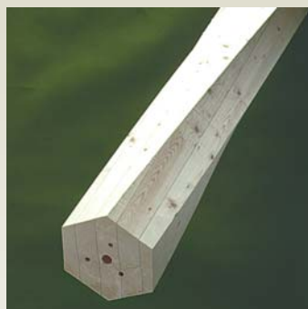
Søjle S2 - Gran Form: 6-kantet / 1/2 Dimensioner: 90 - 350 mm Længde: 0 - 6000 mmmm