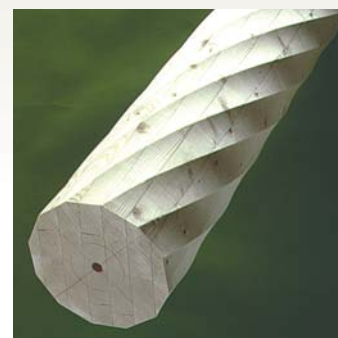
Søjle S12 - Gran Form: 12-kantet / 1 1/2 Dimensioner: 90 - 350 mm Længde: 0 - 6000 mm