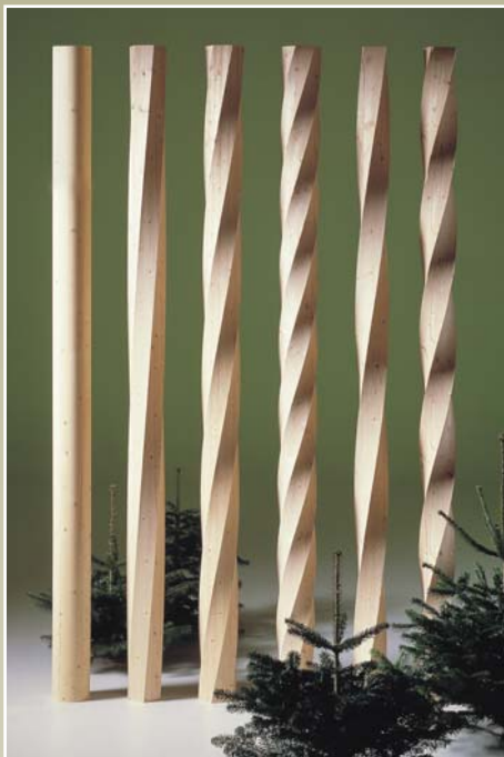
Søjler i gran: S1, S2, S3, S4, S5, S6