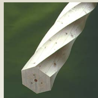
Søjle S4 - Gran Form: 6-kantet / 1 1/2 Dimensioner: 90 - 350 mm Længde: 0 - 6000 mm