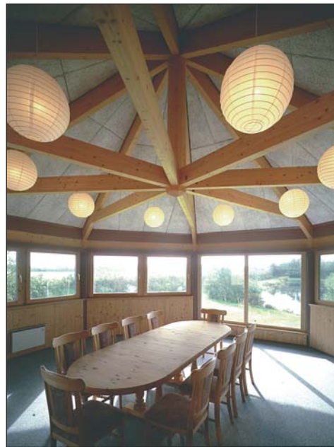
Loftkonstruktion i 8-kantet søjlehus.