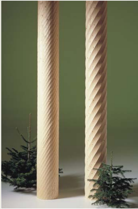
Søjler i gran: S13, S14