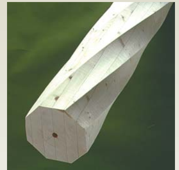
Søjle S8 - Gran Form: 8-kantet / 1 Dimensioner: 90 - 350 mm Længde: 0 - 6000 mm