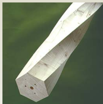
Søjle S3 - Gran Form: 6-kantet / 1 Dimensioner: 90 - 350 mm Længde: 0 - 6000 mm