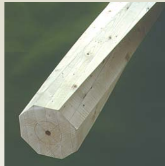
Søjle S7 - Gran Form: 8-kantet / 1/2 Dimensioner: 90 - 350 mm Længde: 0 - 6000 mm