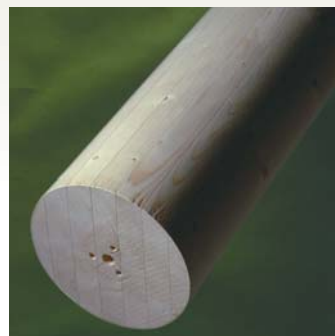
Søjle S15 - Gran Form: cirkulær Diameter: 90 - 700 mm Længde: 0 - 9000 mm