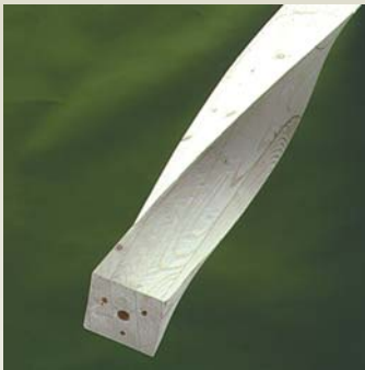
Søjle S5 - Gran Form: kvadratisk / 1 Dimensioner: 90 - 350 mm Længde: 0 - 6000 mm