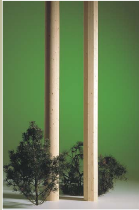
Søjler i gran: S15, S16