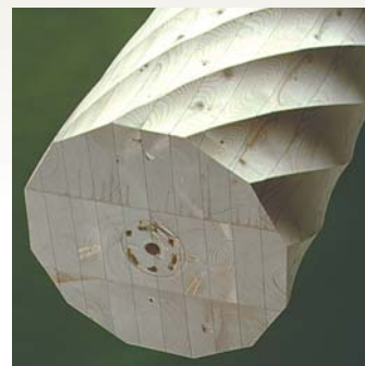
Søjle S14 - Gran Form: 12-kantet / 1 1/2 Dimensioner: 90 - 350 mm Længde: 0 - 6000 mm