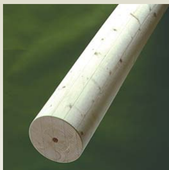
Søjle S1 - Gran Form: cirkulær Diameter: 90 - 700 mm Længde: 0 - 9000 mm