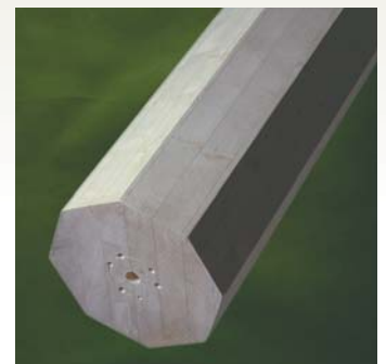
Søjle S16 - Gran Form: 8-kantet Dimensioner: 90 - 350 mm Længde: 0 - 6000 mm