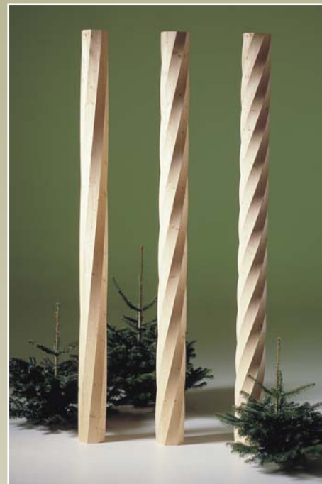
Søjler i gran: S10, S11, S12