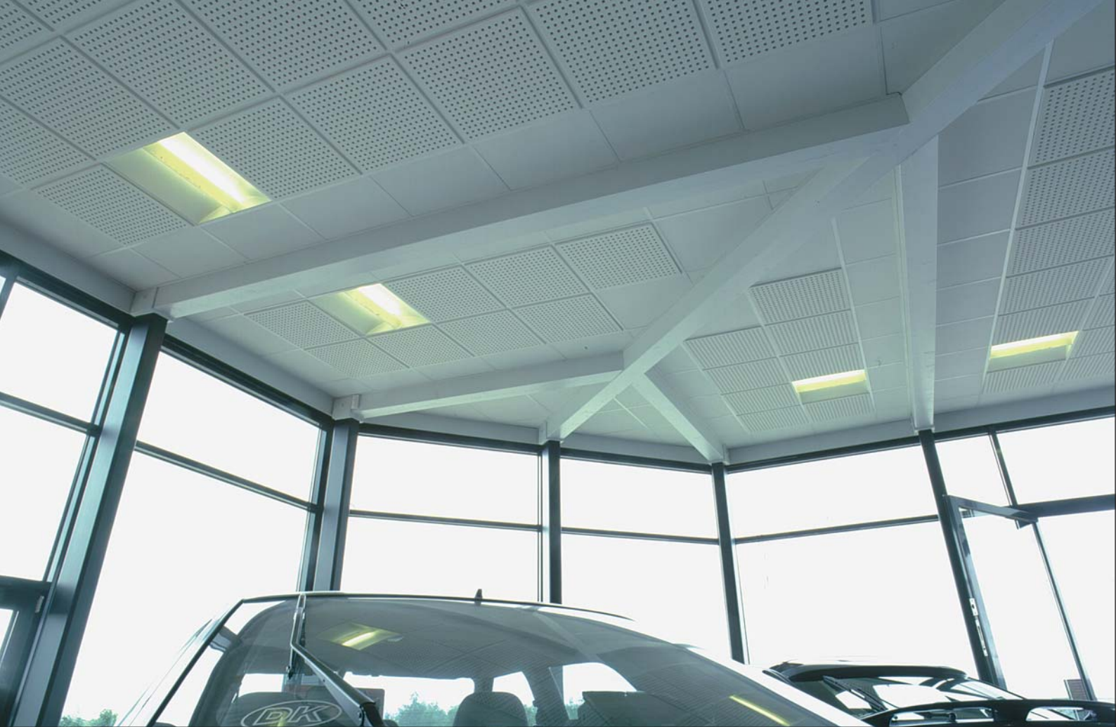
Loftkonstruktion Steen's MC-Center Tarp pr. Esbjerg