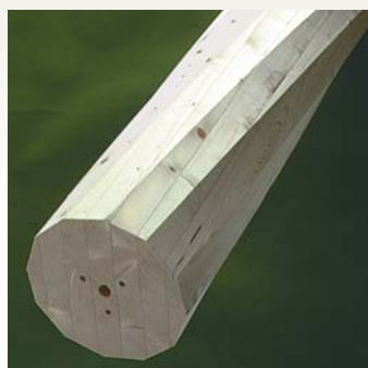
Søjle S10 - Gran Form: 12-kantet / 1 1/2 Dimensioner: 90 - 350 mm Længde: 0 - 6000 mm