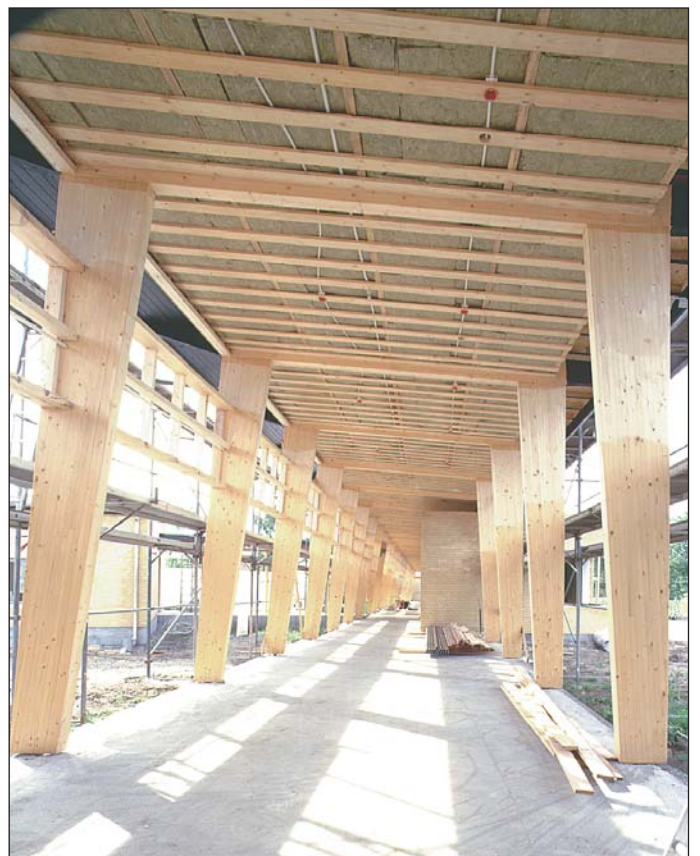
Limtræssøjler og -bjælker på Bregnbjerg Plejecenter i Vojens. Bygherre: Hoffmann & Sønner