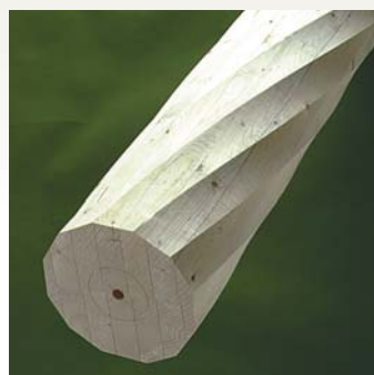
Søjle S11 - Gran Form: 12-kantet / 1 Dimensioner: 90 - 350 mm Længde: 0 - 6000 mm