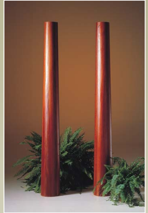
Søjler i mahogni: K17, K18