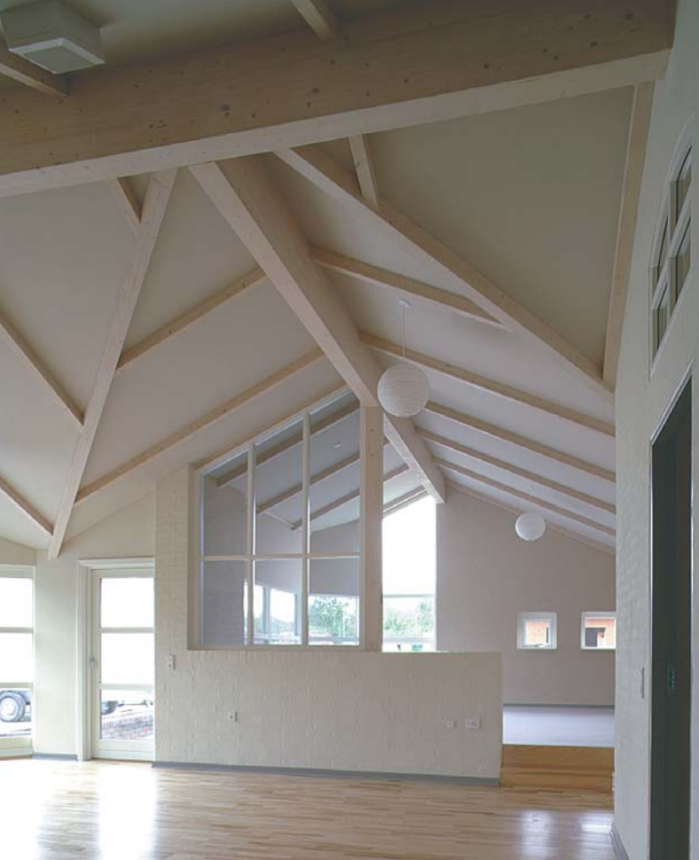
Loftkonstruktion i nyt parcelhus i Lunde.