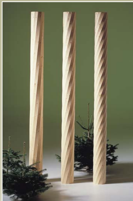
Søjler i gran: S7, S8, S9